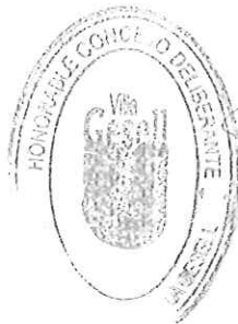
ILLATAGUERRE MYRIAM ELIZABET PRESIDENTE Honorable Concejo Deliberante Municipalidad de Villa Gesell